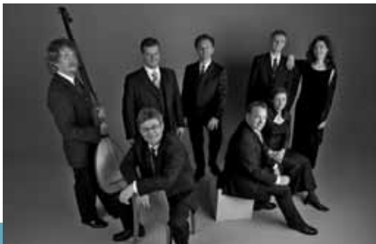
Gesualdo Consort Amsterdam

Mi, 2. Mai | 20 Uhr | ca. 2 Stunden (mit Pause) | 8,- €, ermäßigt 4,- € Veranstalter: Collegium musicum der Universität zu Köln