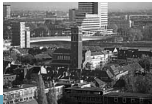
Blick über Trinitatis

»Es ist für uns eine Zeit angekommen...« Das Gestern und Heute von Brauchtum wird bei dieser Führung mit Günter Leitner in Kirchen und auf Plätzen mit seiner Geschichte vorgestellt.