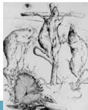
Günter Grass Golgotha (1985)