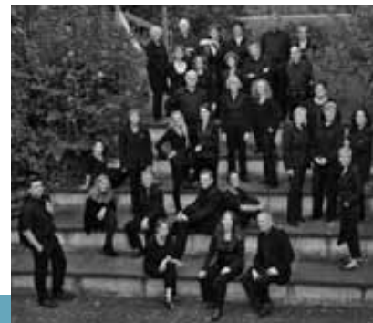
Rodenkirchener KammerChor und Orchester