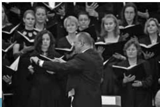
reger chor köln