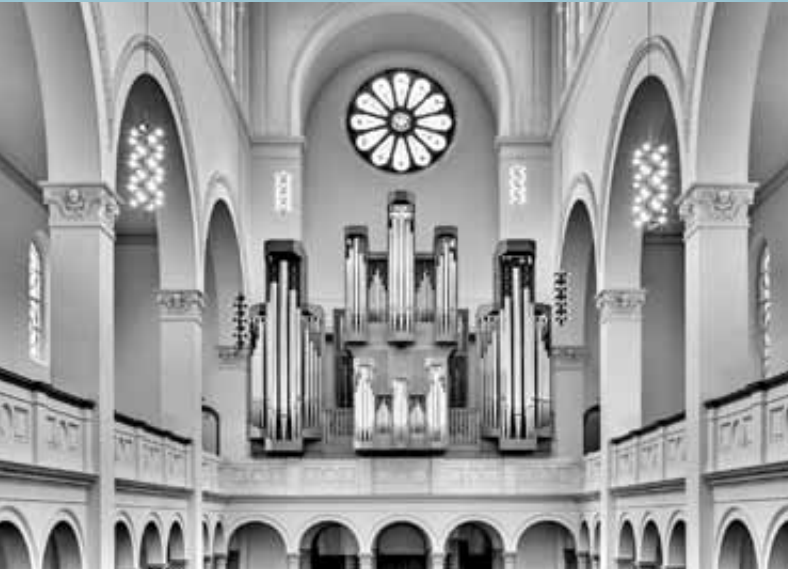
Klais-Organ in der Trinitatiskirche