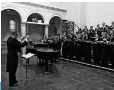
reger chor köln

So, 28. Okt | 17 Uhr | 1,5 Stunden | 21,- €, ermäßigt 14,- €